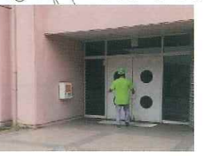
AED (すすかけ台小学校)